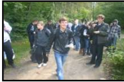
KLASA III F WYMIATA

To nie lada wyzwanie, iść z III f na świata sprzątanie. ;)